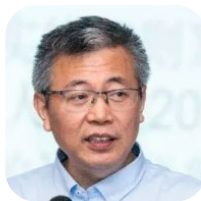
周立 ZHOULI 清华大学经济管理学院会计系教授； 博士生导师； 海淀区政府顾问； 北京国家会计学院兼职教授。