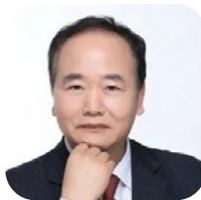
曹和平 CAOHEPING 现为北京大学经济学院教授、 经济学博士生导师； 北京大学数字中国研究院副院长。