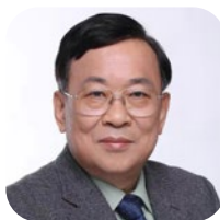
何小锋 HEXIAOFENG 现为北京大学经济学院金融学系教授； 北京大学经济学院顾问委员会主席； 兼任北京大学首都发展研究院副院长； 中国股权投资协会副会长。