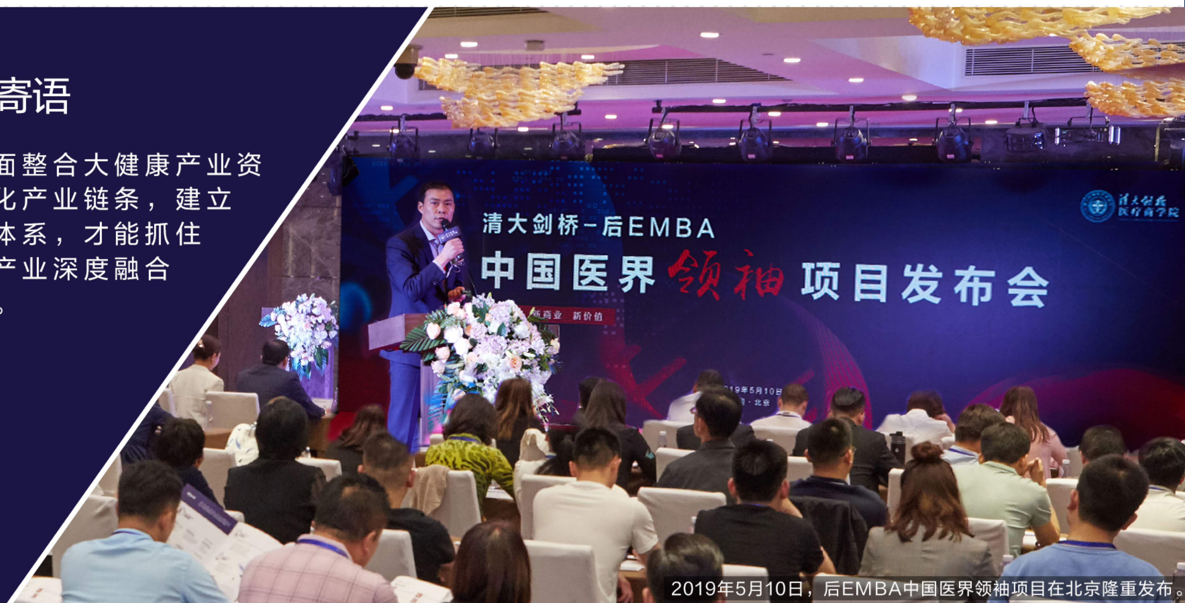
2019年5月10日，后EMBA中国医界领袖项目在北京隆重发布。

只有全面整合大健康产业资源，优化产业链条，建立生态圈体系，才能抓住大健康产业深度融合的契机。