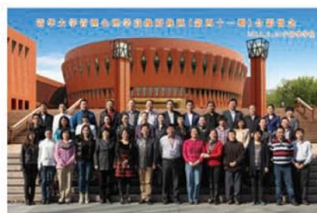
班级合影：第 41 期