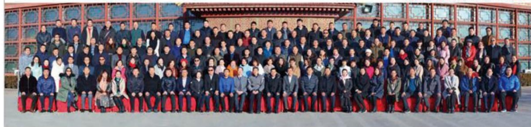
清友·明道 第二十一届中国企业家高峰论坛 2018.12.15于京东总部