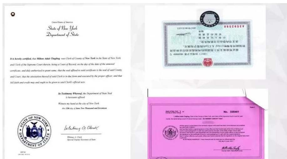
美国州政府及领事馆认证样本