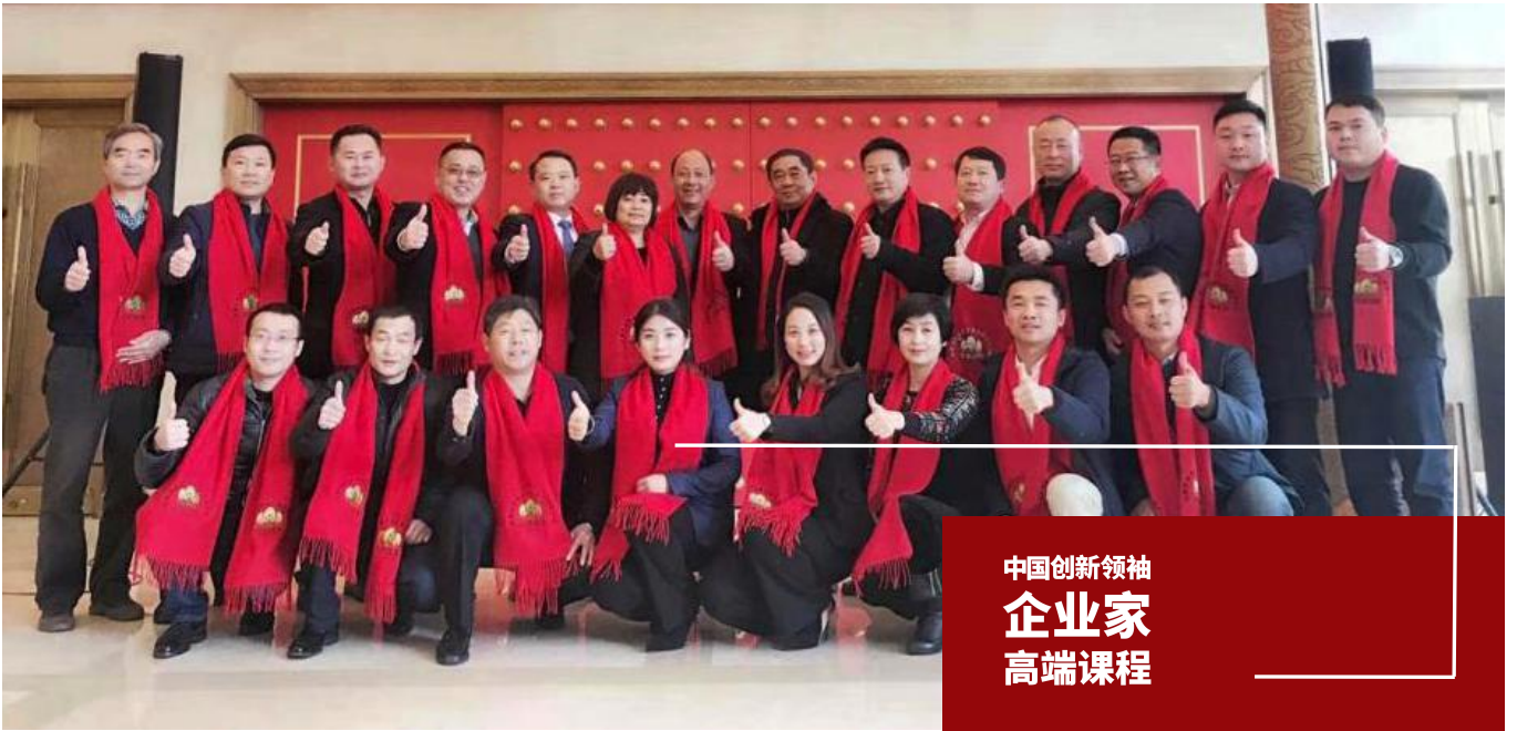
中国创新领袖 企业家 高端课程