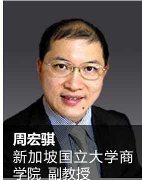
周宏骐 新加坡国立大学商学院 副教授