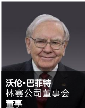
沃伦·巴菲特 林赛公司董事会 董事