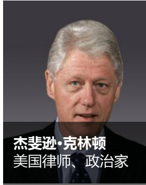
杰斐逊·克林顿 美国律师、政治家