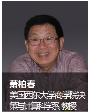
萧柏春 美国西东大学商学院决策与计算机科学系 教授