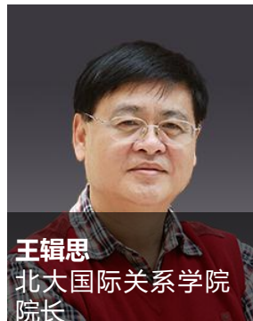
王辑思 北大国际关系学院 院长