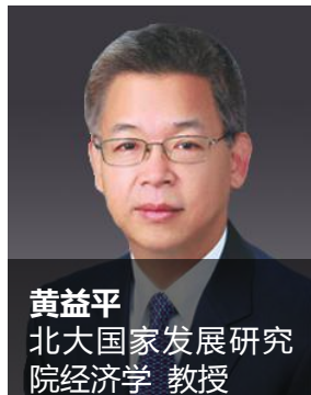
黄益平 北大国家发展研究院经济学 教授